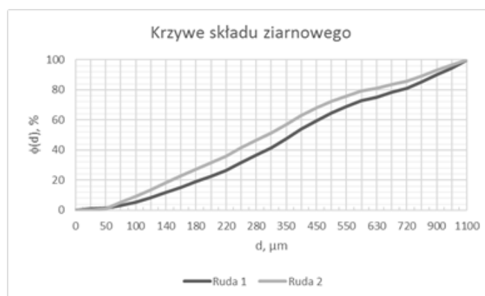
Rys. 1. Krzywe składu ziarnowego badanych próbek rudy złota po odsianiu klasy > 0,8 mm Fig. 1 Particle size composition curves for gold ore samples after removal the size fraction > 0.8 mm