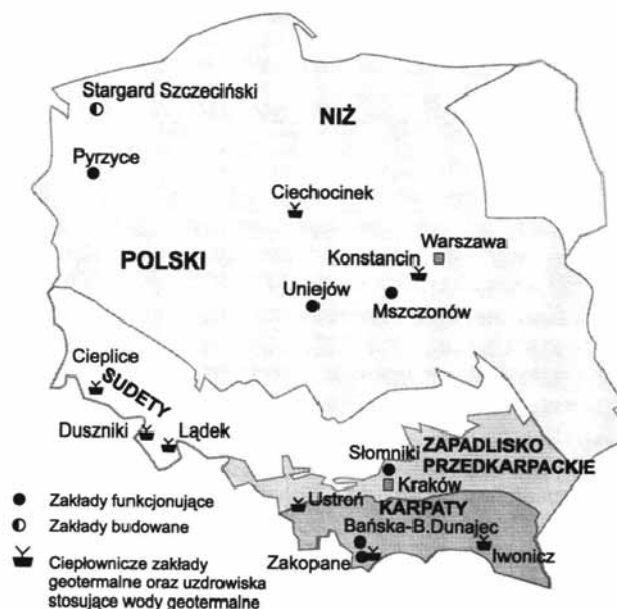
Rys.1 Rozmieszczenie istniejących i planowanych zakładów wykorzystujących energię geotermiczną na terenie Polski