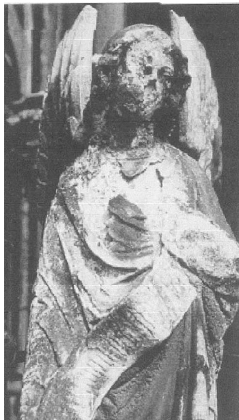
Rys. 1 Mikrobiologiczna deterioracja posągu anioła z portalu katedry w Kolonii, Niemcy; porównanie z dokumentacją z 1880 r. ( http://www.nd.edu/~ssaddawi/Course499.htm )